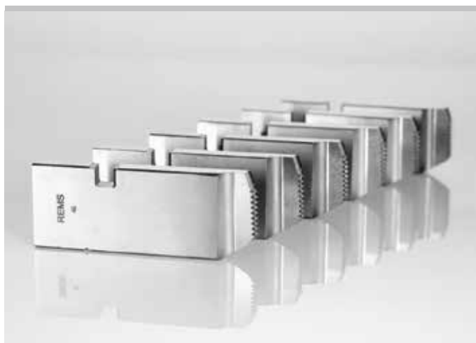
Kvalitní německý výrobek