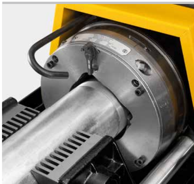
Kvalitní německý výrobek

Racionálně s automatickým vnitřním upínáním s REMS Nippelfix ¼–4" nebo s manuálním vnitřním upínáním s REMS Nippelspanner ¾–2" (strana 48).