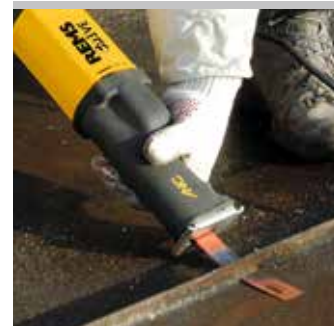
Tested by electrosuisse >>>