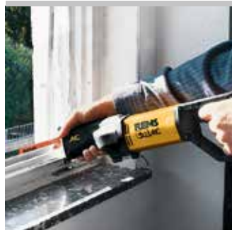
Kvalitní německý výrobek