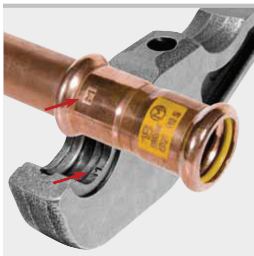
Příklad lisovacích kleští REMS M: Otisk "M" na zalisované tvarovce pro zpětné dosledování dle EN 1775:2007

Tímto zpětným dosledováním splňuje REMS doporučení evropské normy EN 1775:2007 pro instalace lisovaných systémů na plyn.