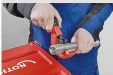
Presné rezanie Inox rebrovaných rúr