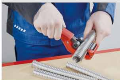
Presné vedenie rúr