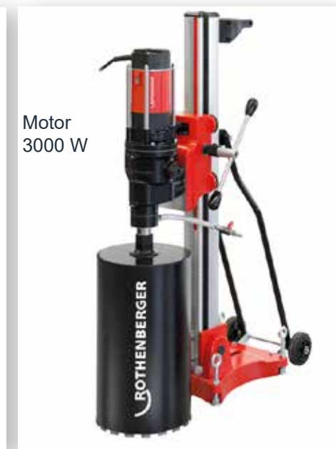
Motor 3000 W