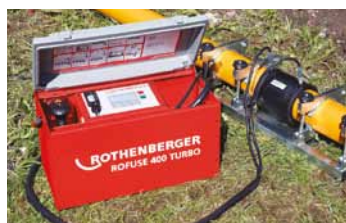
Robustný kryt prístroja Na transport a na uloženie príslušenstva