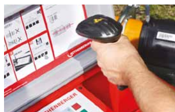
Protokolovací softvér S funkciou generovania mena a kódu zvärania