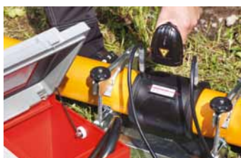
Bezdrôtový skener Pohodlné skenovanie čiarových kódov, rozsah 50 m