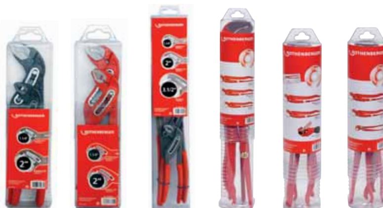
Obj.č. 1000001039 Obj.č. 1000000626 Obj.č. 1000001068 Obj.č. 070130X Obj.č. 070135X Obj.č. 070140X