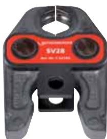
Klasická čeľusť (SV28)

Obj.č. 1000001274 Cena: 354,95 € Cena s DPH: 425,94 €