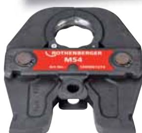
3-segmentová čeľusť (M54)

Sada 15800 obsahuje: stroj ROMAX 3000, akumulátor 18V/3,0Ah Li-Ion (15810), nabíjačka (15811), plast.kufor (1500000463), bez čeľustí Sada 1000001001 obsahuje: stroj ROMAX 3000 AC, plast.kufor (1500000463), bez čeľustí