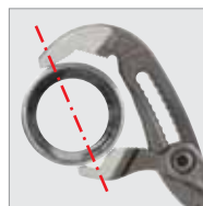
3-bodový úchyt: bezpečnejšie zovretie, perfektné uchopenie pri veľkých priemeroch, verzia XL až do 3.1/2"